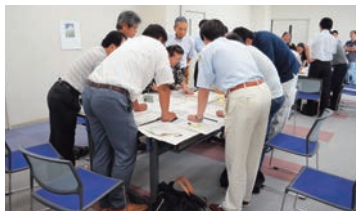
HUG(避難所運営ゲーム)の様子

地域防災力の強化のため、岐阜県と岐阜大学が共同して4月1日に岐阜大学構内に開設しました。